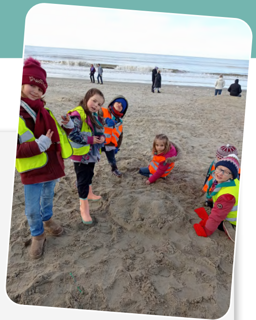
■ Papaye, Canasta, Picotin - Animatrices Colonie

Le dimanche, nous avons partagé nos souvenirs et nos ressentis autour de la souche de vérité, avant de faire nos valises et de se dire au revoir... »